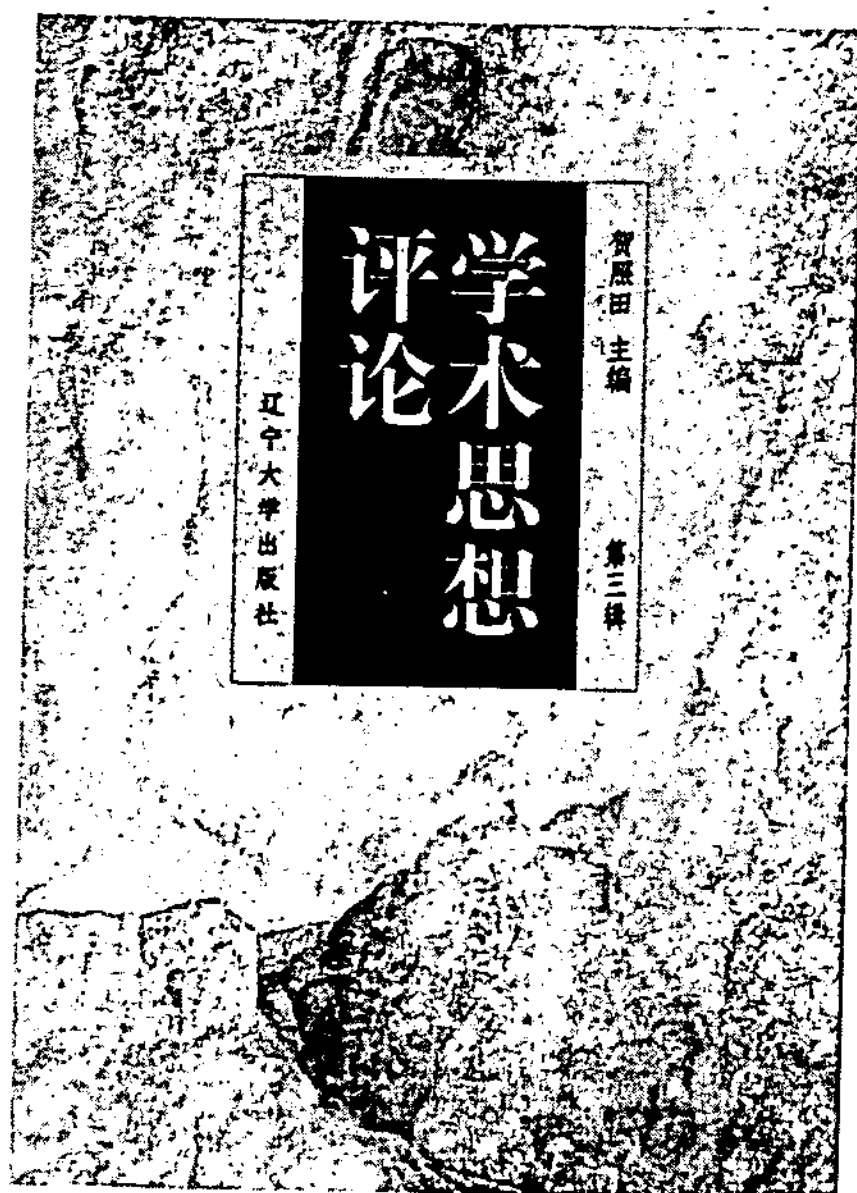
《學術思想評論》（瀋陽：遼寧大學出版社，1997- ）。

《學術思想評論》已經出版四輯，它顯示了越來越自覺的自我定位，這就是嘗試建立以學術為基本立腳點的思想立場。最令人注意的是從第一期開始就被排在最前面的「學術現象論析」，該欄目顯然意在倡導研究者對於自身問題能力的反省運思，以尋找那些真正能夠生長的問題。