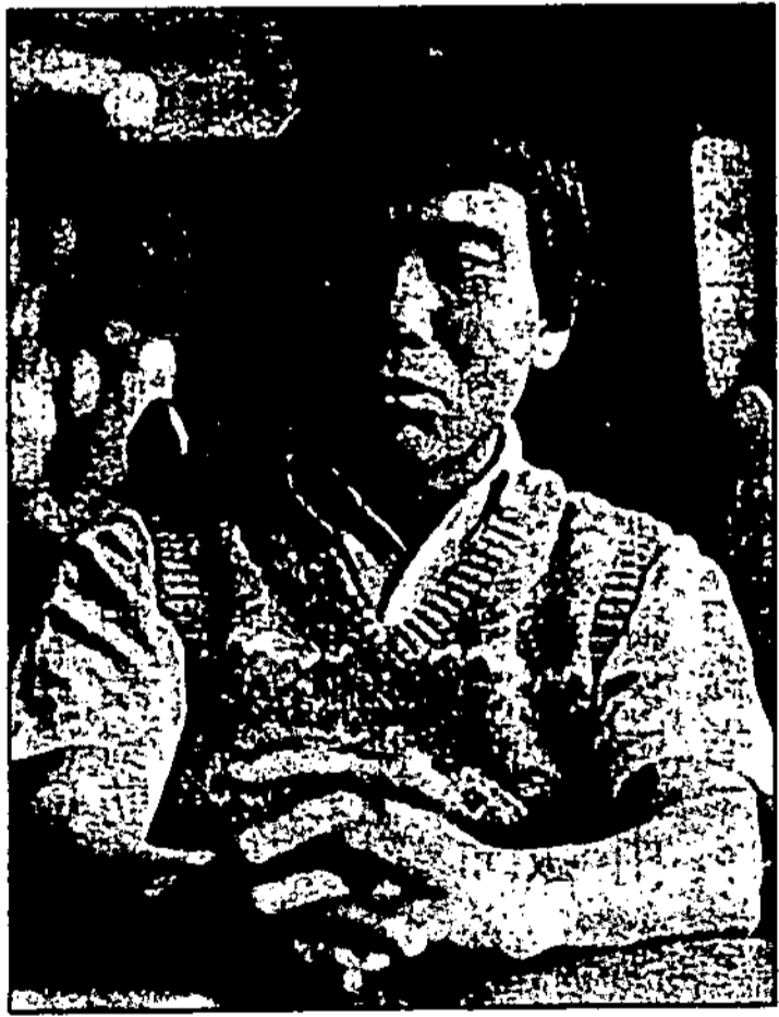
村上春樹覺得自己仍難以捕捉到受害者的內心感受。