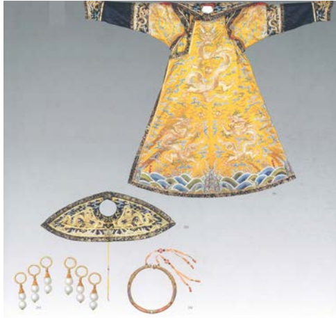
圖 6：皇太后的金約與耳環