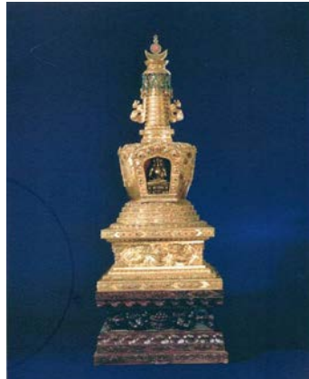
圖 4：崇慶皇太后金髮塔

資料來源：阮衛萍，〈清宮后妃首飾的特性〉，《紫禁城》，期 258（2016 年 7 月），頁 101。