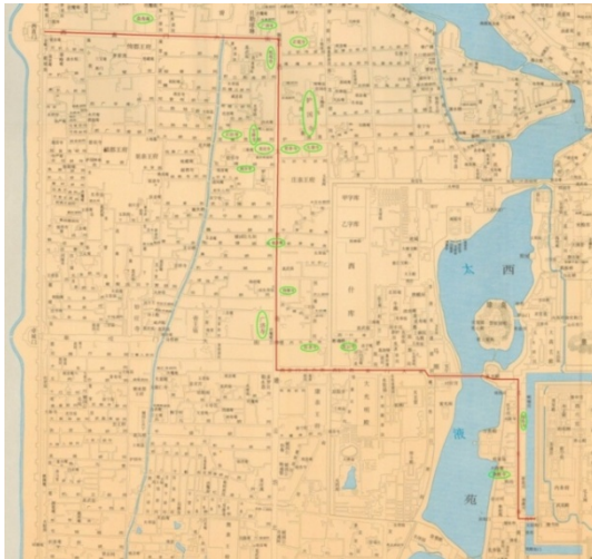
圖 7：西華門至西直門沿途的寺廟