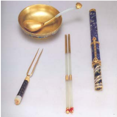
圖 3：皇太后進膳用具圖