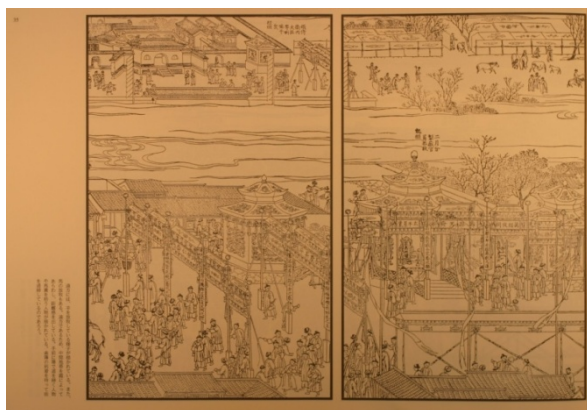
圖 9：《康熙萬壽盛典圖》唸經場景