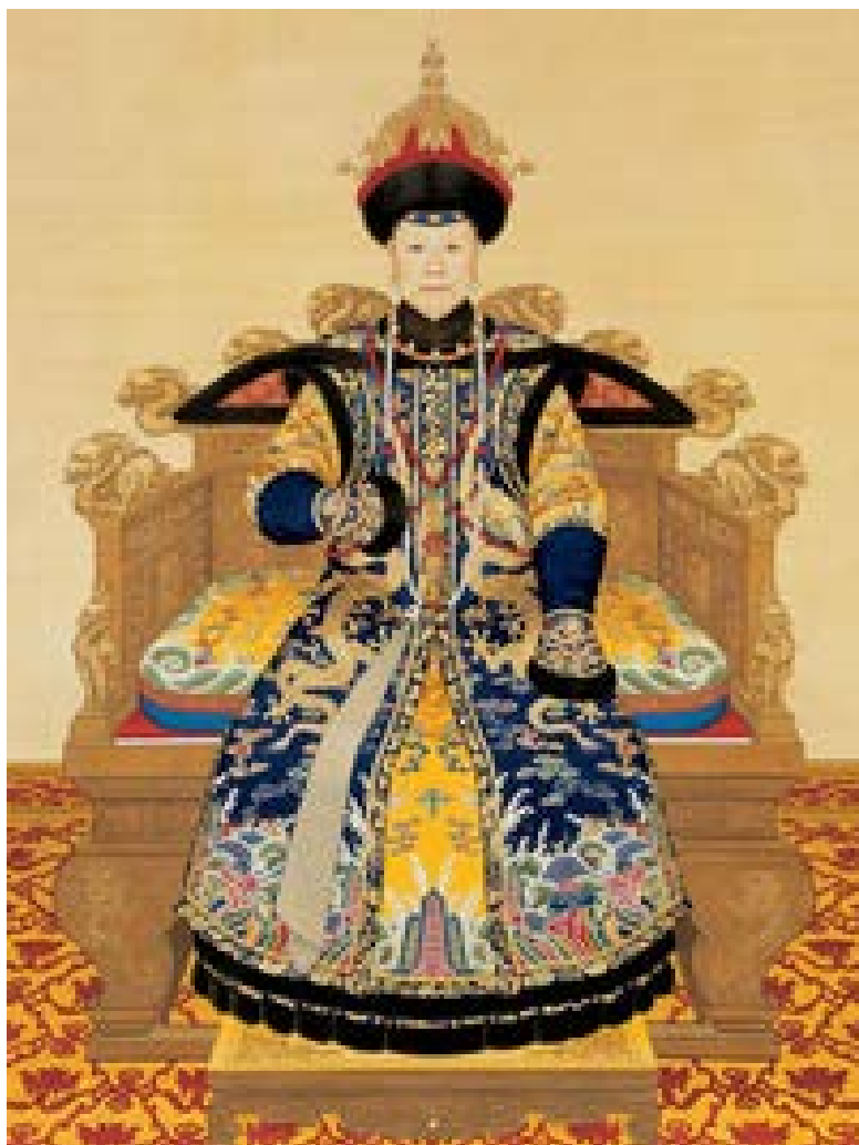
圖 1：崇慶皇太后畫像