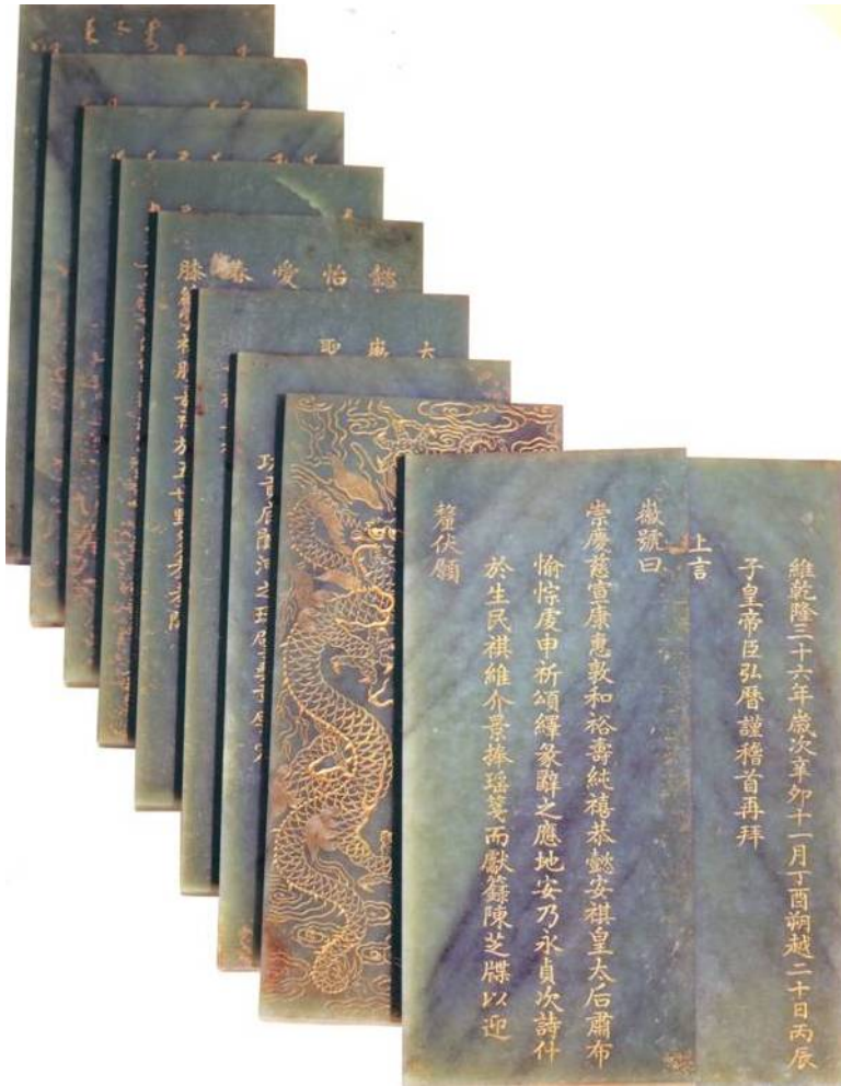
圖 2：崇慶皇太后上徽號玉冊